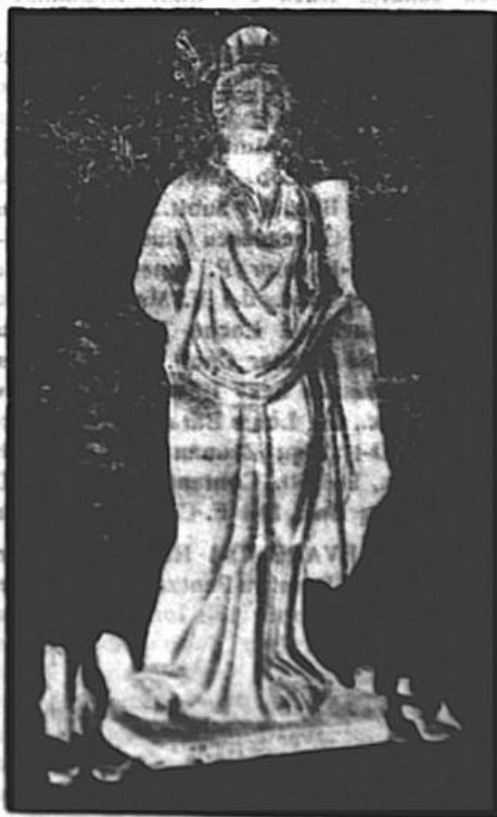
Statue găsită în săpăturile Constanței.

De bătrânul Tomis nici nu se mai pomenia, acum, când însăși Constanța nu mai era decât o ruină.